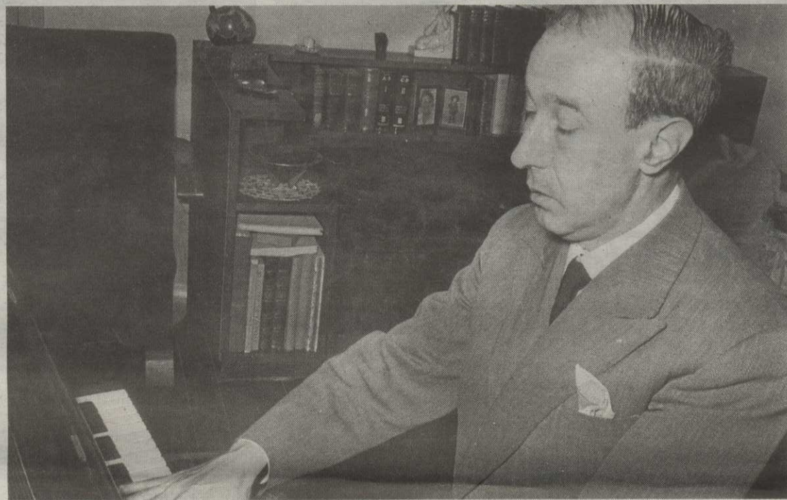
La música está muy presente en la obra del poeta santanderino.

Gerardo Diego afrontó hace un siglo trece sesiones, en formato de conferencia-concierto, en las que desgranaba e interpretaba la historia del repertorio escrito para piano desde el siglo XVIII hasta la contemporaneidad: un total de